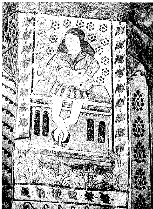
Vihuelaspelaren från Edebo kyrka i Uppland.

Lutan var känd i Sverige redan i början av 1400-talet och vi kan finna många spår av den under de följande århundradena. Förhållandet är inte detsamma beträffande gitarren: Den var ett ganska okänt instrument ända till 1800-talets början. Vi kan dock finna några antydningar om att gitarren eller gitarliknande instrument verkligen har använts under tidigare perioder. En målning i Edebo kyrka i Uppland, som kan dateras till 1514, antyder till och med att vihuelan uppträtt i Sverige redan i början på 1500-talet. Dessvärre är den ikonografiska dokumentationen av tveksamt bevisvärde om den inte kan understödjas av andra fakta. Mest sannolikt är att konstnären, som framställde målningen i Edebo kyrka, hämtat sin förlaga utomlands. Trots detta är målningen intressant som en mycket tidig avbildning av vihuelan. Edebo-instrumentets lock har vihuelans karakteristiska inläggningar, men det finns andra detaljer som skiljer: Avsaknaden av ett ljudhål, den bakåtböjda skruvlådan och det faktum att strängarna är fästade vid den undre delen av locket och inte vid ett stall. Den bakåtböjda skruvlådan är emellertid inte unik för Edebo-instrumentet. Samma konstruktion visar den berömda bilden av Marcantonio Raimondo föreställande en vihuelaspelande man och som är ungefär samtida med Edebo-målningen.