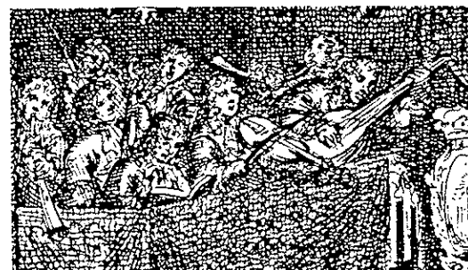
Medlemmar ur hovkapellet vid den avslutande banketten 1672. Detaljer ur en gravyr från ca 1680 av G C Eimmart baserad på en teckning av David Klöcker Ehrenstrahl.