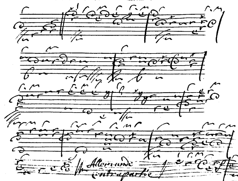
Stiftelsen Musikkulturens främjande, luthandskrift i litet format, fol. 63 v och 64 r , "Allermande Contrapartie" (till Denis Gaultiers Tombeau de Mons r de Lenclou ).